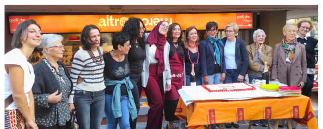
Il momento del taglio della torta

La festa di inaugurazione si è svolta il 15 ottobre con una gioiosa sfilata di moda etica che ha mostrato la collezione autunno/inverno appena arrivata e il brindisi con taglio della torta per la felicità di tutti i partecipanti.