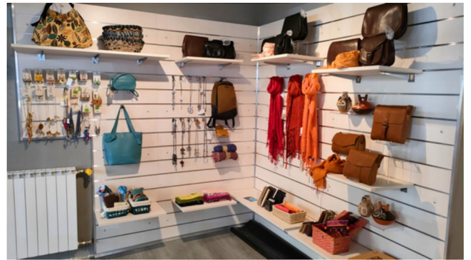
Ingresso e zona moda dopo la ristrutturazione

Il risultato finale ha colpito molto positivamente i clienti che alla riapertura non si sono trattenuti dal fare i complimenti alle volontarie presenti facendoci ben sperare per un incremento considerevole delle vendite.