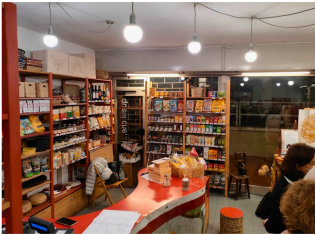
Zona cassa e scaffali prima della ristrutturazione

Con un investimento di circa 10 mila euro siamo intervenuti ridipingendo le pareti, sostituendo il pavimento, rifacendo l'illuminazione e acquistando scaffali, tavoli espositivi e bancone cassa nuovi.