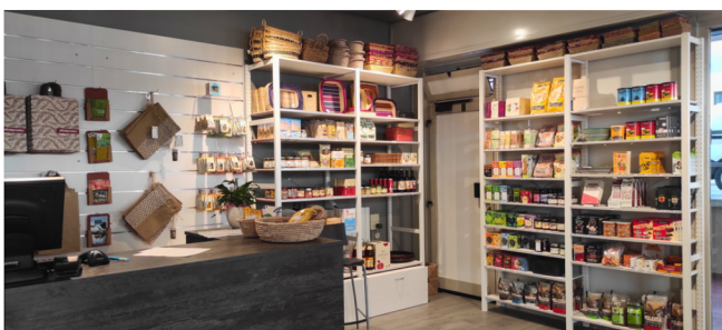
Zona cassa e scaffali dopo la ristrutturazione

Gran parte del lavoro è stato generosamente eseguito dalle volontarie e dai volontari della Bottega con l'intervento di tecnici professionisti dove necessario e con il supporto degli operativi.